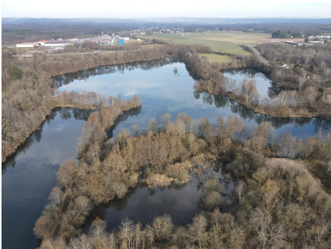
Site de la petite Charme, Corbenay

Organisé par la Fédération de pêche de Haute-Saône, en partenariat avec les AAPPMA de :